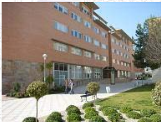
Vista del Edificio Exterior del Edificio A-3. Sede de la mayor parte de los eventos del Congreso